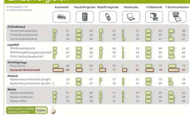
Abb. 3: Vorhersagegüte aller Indikatoren im Einzelvergleich

Hierfür gibt es psychologisch plausible Erklärungen, die, über den konkreten Fall hinaus,