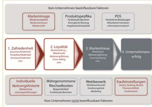
Abb. 1. Faktoren der Kundenloyalität (in Anlehnung an Bruhn & Homburg)

Abgefragt wurden sie auf einer randverbalisierten 11er Skala mit den Skalenpunkten 0 bis 10 oder als Single-Choice Markenabfrage. Im Einzelnen handelt es sich um: